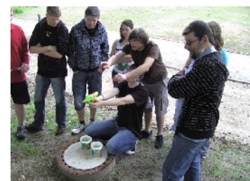
Tolle Spiele bei ConnECt